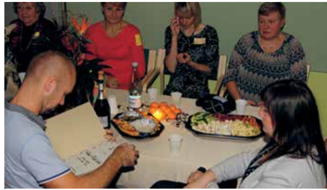
Aasta küla 2016 - Adila ja Pihali

Kohila valla aasta küla rändauhinna on keraamiline kuhu „Hobune“. 29. oktoobril sai suksu omale uue kodu – Kohila valla aasta külaks 2016 valiti Adila-Pihali külade piirkond.