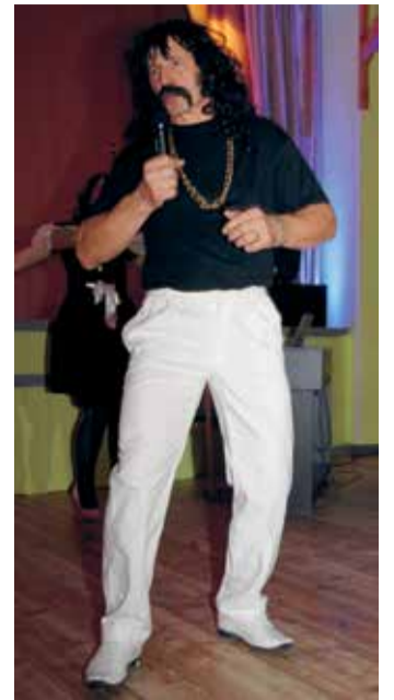
Kas Üllar Jörberg või Alar Haabma?