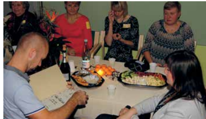
Aasta küla 2016 - Adila ja Pihali

Kohila valla aasta küla rändauhinna on keraamiline kuju „Hobune“. 29. oktoobril sai suksu omale uue kodu – Kohila valla aasta külaks 2016 valiti Adila-Pihali külade piirkond.