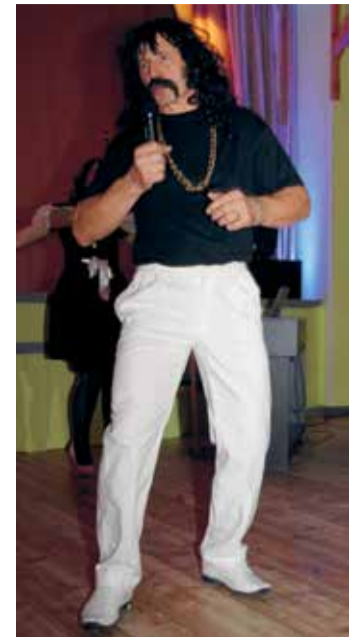
Kas Üllar Jörberg või Alar Haabma?